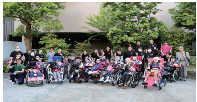
博多どんたく出場