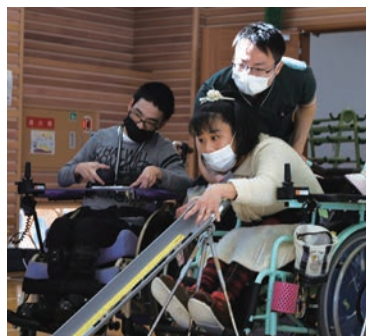
ボッチャ大会出場