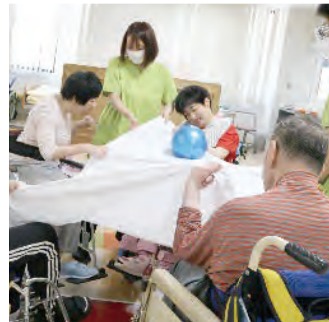
しっかり手でシートを動かしてボール遊びをしています。