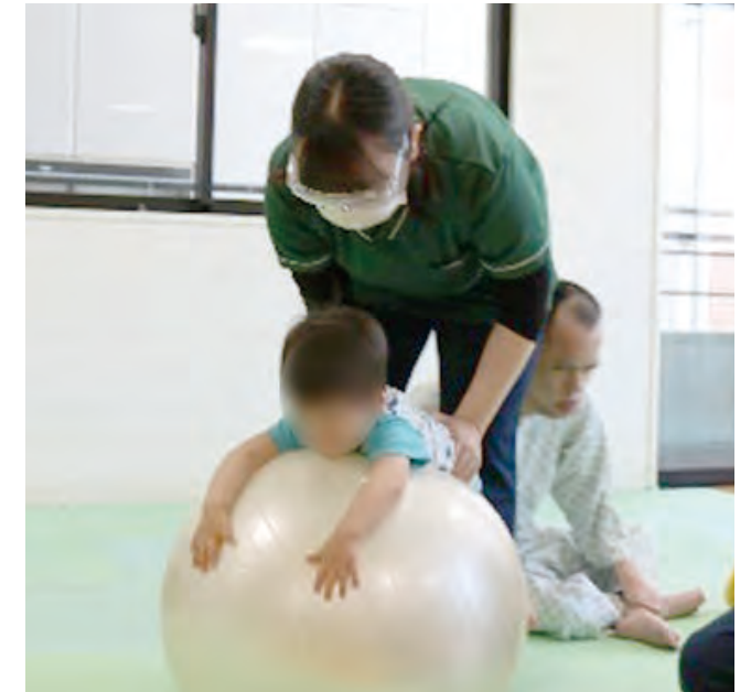
ボールを使った体幹筋トレーニングをしています。