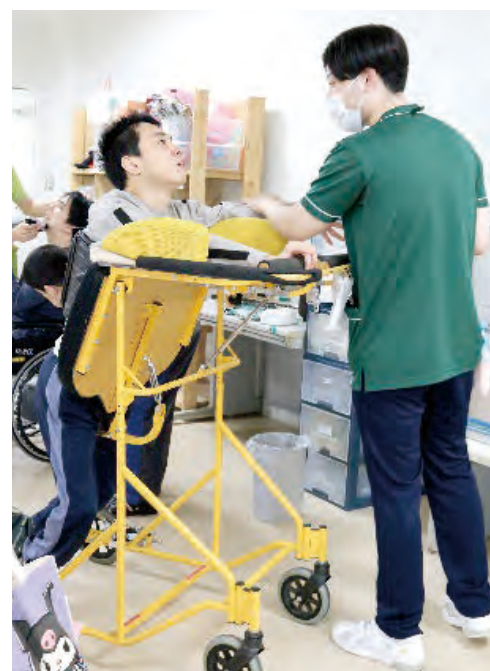
歩行器で足を使って移動します。1回に20分程度運動をすることで、ストレス発散が出来ます。