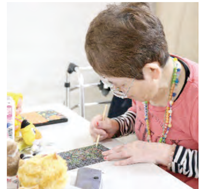
集団が苦手な方は一人で楽しめる作業を提供しています。