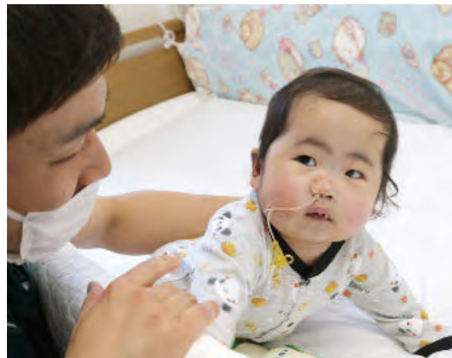
心臓の手術後でバイタルに留意しながら立位座位の獲得訓練を実施しています。