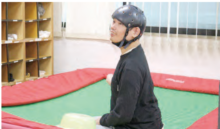
興奮すると自傷行為がみられますが、トランポリンの感覚でリラックスしています。