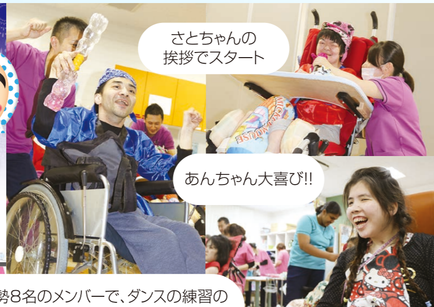
さとちゃんの 挨拶でスタート