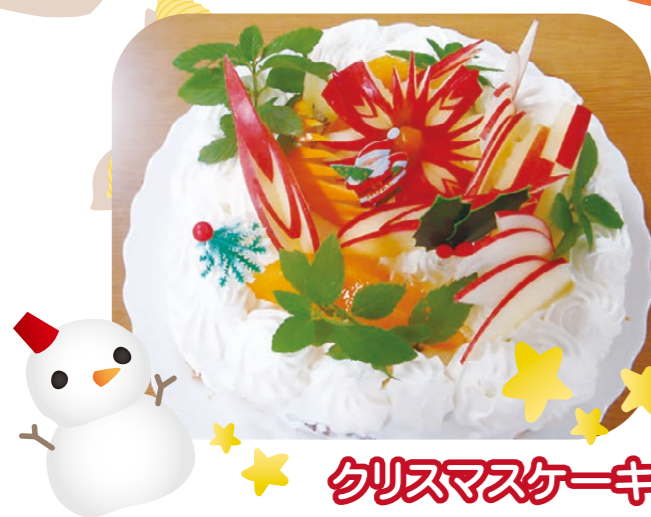
クリスマスケーキ

視覚から楽しくなるような工夫をしてみました。嚙下に問題のある方も、生クリームなら一口味わうことができます。