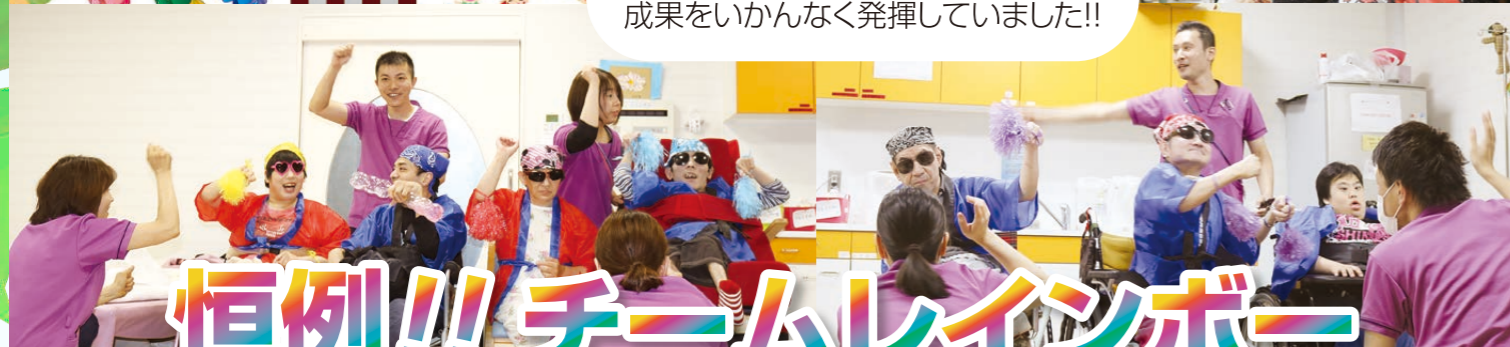
総勢8名のメンバーで、ダンスの練習の 成果をいかに発揮していました!!