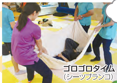
ゴロゴロタイム (シーツブランコ)