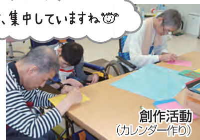
創作活動 (カレンダー作り)