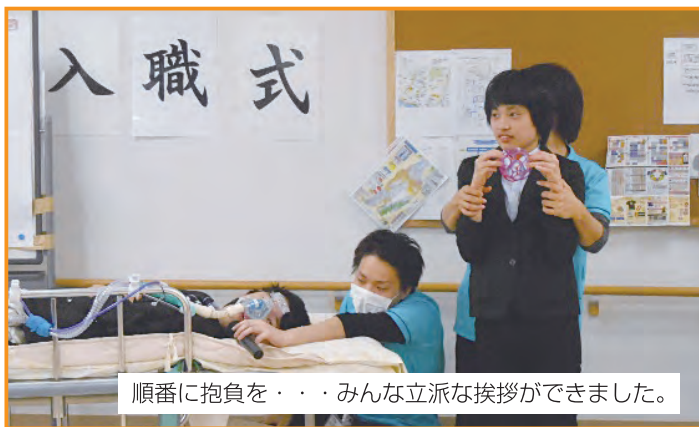
順番に抱負を・・・みんな立派な挨拶ができました。