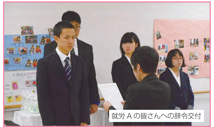
就労 A の皆さんへの辞令交付