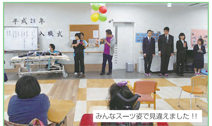
みんなスーツ姿で見違えました!!

昨年、特別支援学校を卒業し虹の家の利用を始めた2人の先輩より、歓迎の言葉が述べられ、お祝いの記念品を生活介護利用者から手渡され式は終了。ほのぼのとした入職式となりました。